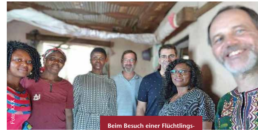
Beim Besuch einer Flüchtlingsfamilie in Bafoussam

Sie sind auch „Reiseleiter“ gewesen und gerade aus Kamerun zurück, wo Sie mit den Delegierten von Bezirkspartnerschaften unterwegs waren.