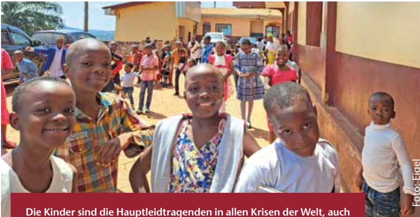
Die Kinder sind die Hauptleidtragenden in allen Krisen der Welt, auch in Kamerun. Im englischsprachigen Teil sind seit Jahren die staatlichen Schulen geschlossen.

Beim Nothilfe- und Wiederaufbauprogramm in Kamerun geht es um Überlebenswichtiges: Nahrungsmittel, medizinische Versorgung, Dach über dem Kopf, Baumaterial, Saatgut usw. Hunderttausende mussten vor dem Bürgerkrieg im englischsprachigen Teil des Landes fliehen, Corona kommt dazu. Die Basler Mission – Deutscher Zweig (BMDZ) fördert den Einsatz ihrer Partner vor Ort, der Presbyterianischen Kirche in Kamerun (PCC). Sie hilft Menschen, die alles verloren haben und nun auch noch von der Pandemie bedroht sind.